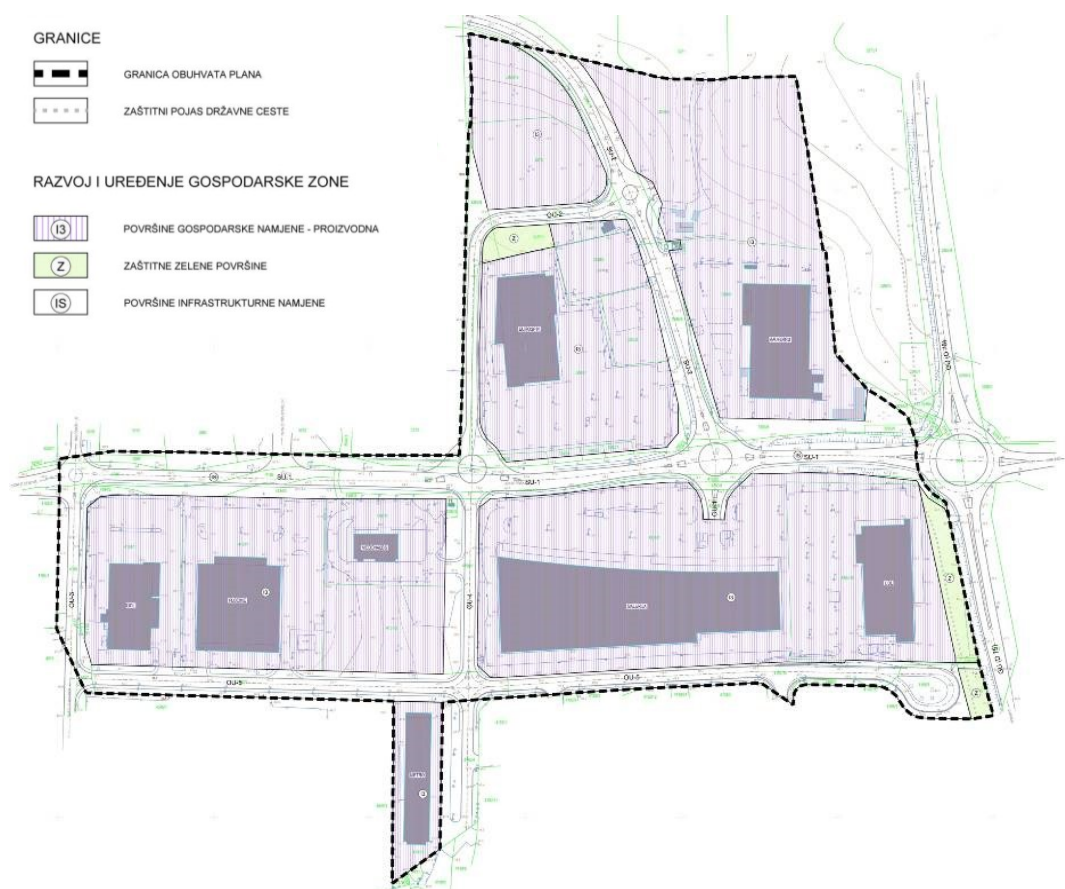
UPU Servisna zona Poreč - područje II, kartografski prikaz 1. Korištenje i namjena površina

Mijenja se odredba u poglavlju Gospodarska namjena- proizvodna (I3) :