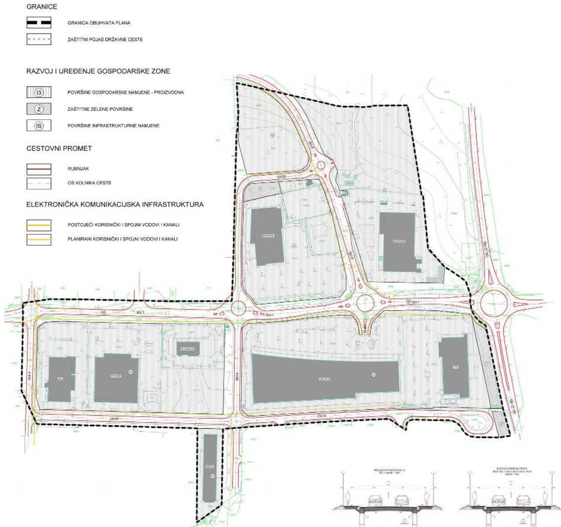
UPU Servisna zona Poreč - područje II, kartografski prikaz