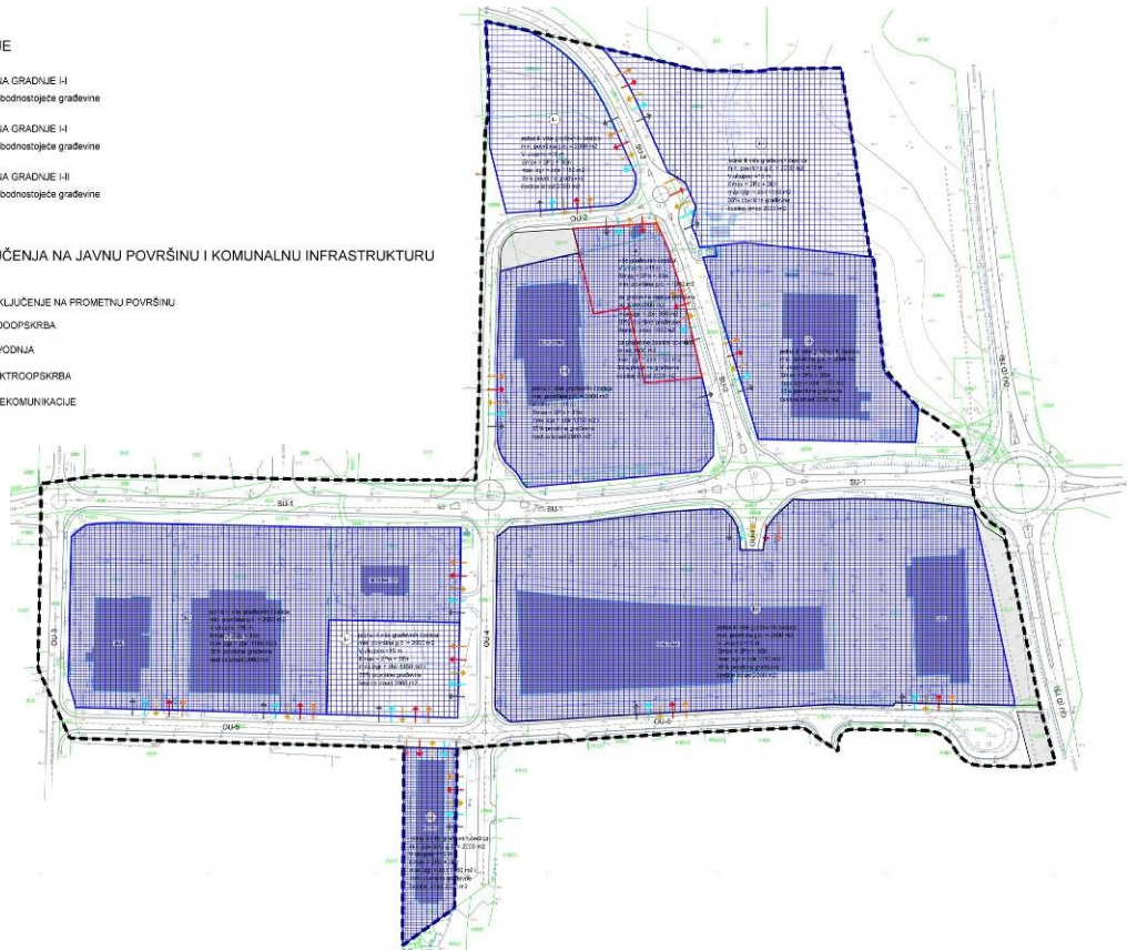
UPU Servisna zona Poreč - područje II, kartografski prikaz 3. Uvjeti korištenja i zaštite prostora

Uvjeti i način gradnje ostaju nepromijenjeni u tekstualnom dijelu, osim kod odredbi Oblik i veličina građevne čestice :